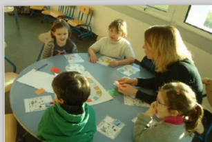
Jeu « assiette équilibrée »