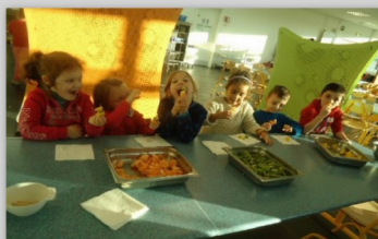
Dégustation de fruits