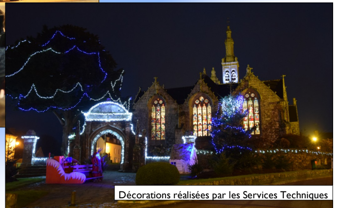
Décorations réalisées par les Services Techniques

Les fêtes de fin d'année sur la commune en images