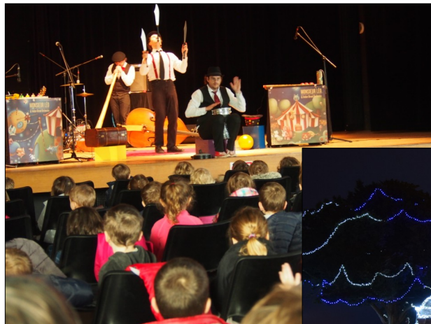
9 décembre 2016 spectacle de Noël pour les 3 écoles

Les fêtes de fin d'année sur la commune en images